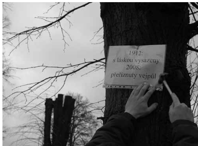
Špatná informovanost občanů o plánovaném kácení stromů vede k nespokojenosti a různým formám protestů, které zatěžují mimo jiné i pracovníky správních orgánů.

besed s občany, dotazníkového šetření nebo jiných akcí, které umožní veřejnosti získat informace a uplatnit připomínky. Správní orgán se tak vyhne zbytečným průtahům během samotného řízení a předejde podání odvolání.