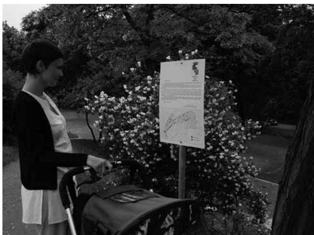
Radnice Prahy 4 plánovala v roce 2009 rozsáhlé kácení v parku Na Jezerce. Přímou do parku umístila informační tabule, kde se mohli občané se záměrem včas seznámit

V případě, kdy lze předpokládat rozsáhlejší polemiku o vhodnosti daného záměru (ať už samotného kácení, nebo např. umístění stavby, která si vyžádá kácení), je vhodné uspořádání kulatých stolů,